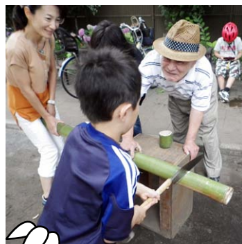
竹工作 始まりました