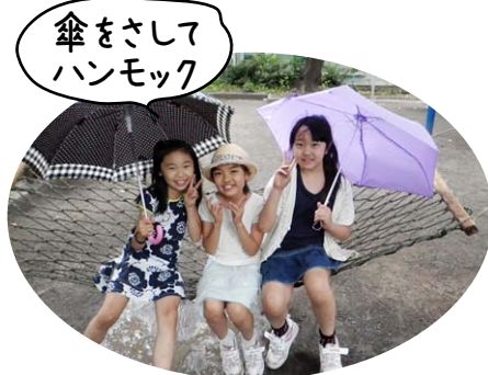
傘をさして ハンモック