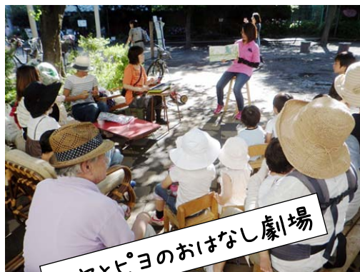
ヤヤとピヨのおいなし劇場