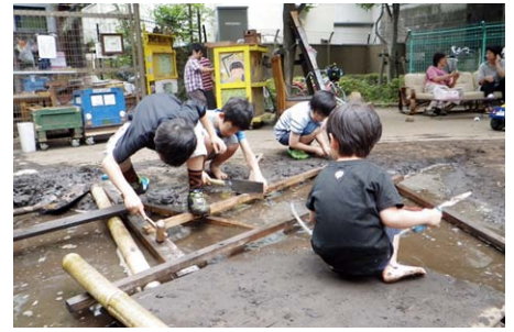
今日も泥んこ 橋作り?