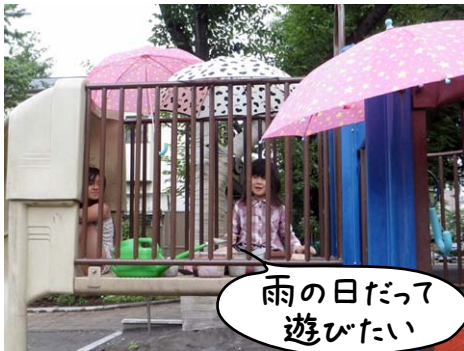
雨の日だって 遊びたい