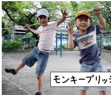
モンキーブリッジ