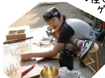
足は どうなっ ているの でしょう