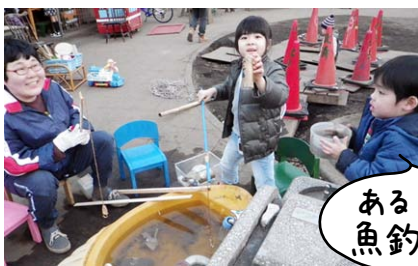
ある日突然 魚釣りブーム