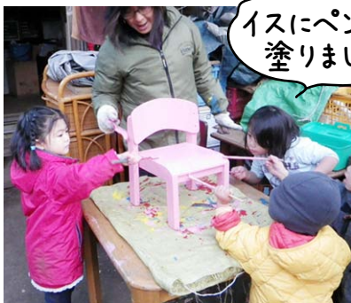
イスにペンキを塗りました