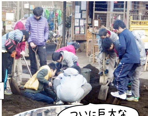
ついに巨大な穴が出現