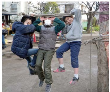
モンキーブリッジの上に ↓「見ざる聞かざる言わざる」