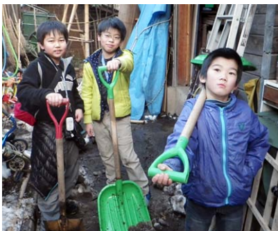
↓雪かき三人組大活躍