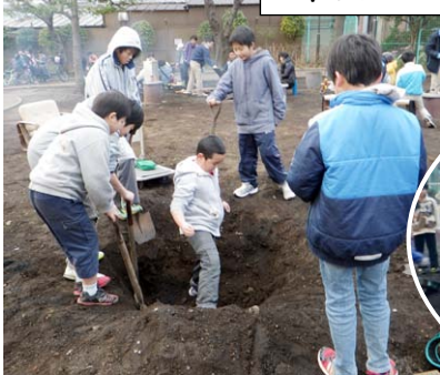
↑さすがに手際がいい