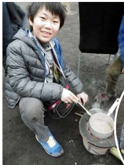
←料理1 あやしいなべ・・・