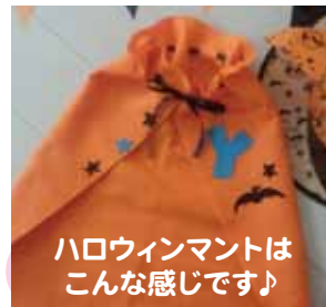
ハロウィンマントは こんな感じです♪

品川区で活動する先輩ママのグループ 「はっぴいママ」が遊びに来てくれますよ♪ みんなで、楽しい読み聞かせのひとときを過ごしましょう。