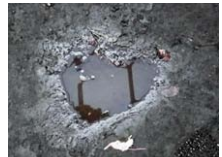
2月14日バレンタインに突然現れる ハート形の水たまり