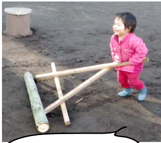
ローラーかいてます