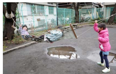
落ちたらびしょ濡れ ↑ スリルたっぷりハンモック