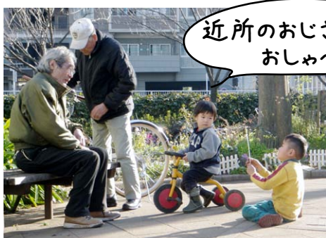
近所のおじさんたちと おしゃべり