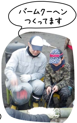
バームクーヘン つくってます