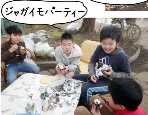
ジャガイモパーティー