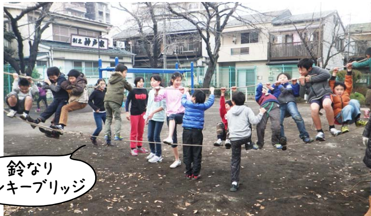
鈴なり モンキーブリッジ