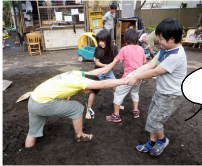
きょーふの 底なし沼